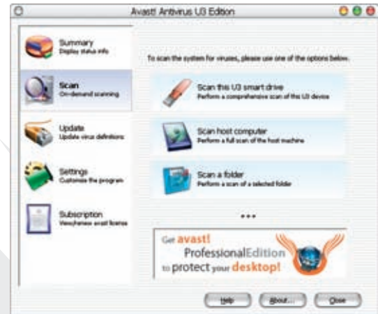
Capture d'écran d'avast! Antivirus Edition U3 (Scan)